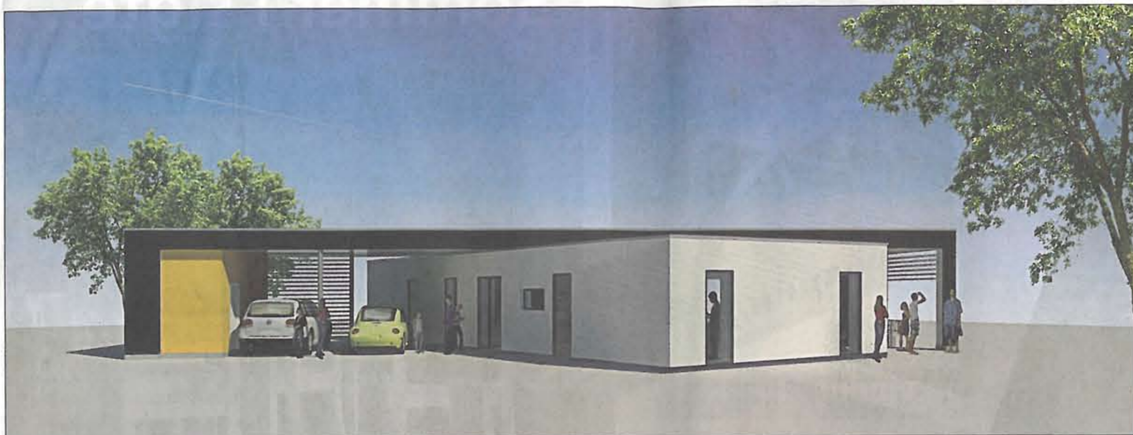
Sort træ i kontrast til den hvide pudrede facade og en fræk detalje i gult i carporten. De to længer står ikke vinkelret på hinanden, men i en 40-45 graders vinkel. (Illustration: Lundhilds Tegnestue)