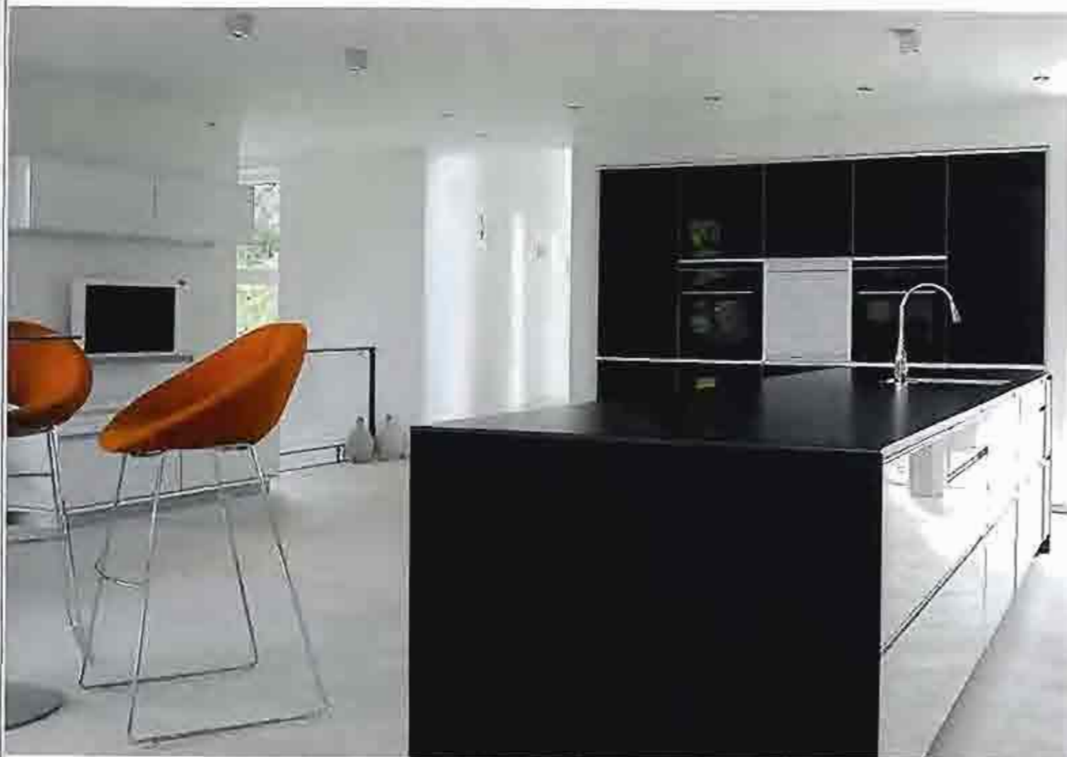
Et af ejendommens naturlige samlingspunkter er udover jagtstuen det luftige køkken, hvorfra husets fire længer udgår. Elementerne er fra Aino og hvidevarerne fra Siemens. Loungemøblerne er fra hollandske Artofort.

op ved siden af os i udstoppet slækkelse. Og så om den helikopterlandingsbane, han egentlig gerne ville have anlagt lige ude foran. Og som han ligger strakt dér på sofaen blandt alle sine præmierede trofæer og med den nyanlagte pejs for enden, der om aftenen kaster flakkende skygger op på alle dyrenes glasøjne, vender tankerne om Karen Blixens farm på forunderlig vis tilbage. "Jeg har en farm i Danmark," kunne han garanteret finde på mumle en aften, han sad her alene. Og således også ejendommens heldige, fremtidige ejere. ■