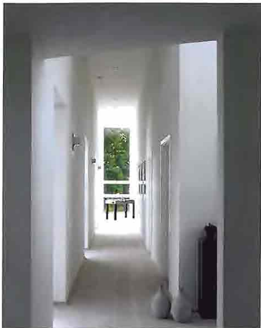
En længe af huset bliver benyttet til børneværelse og kontor, men den smalle korridor, der løber langs rummene, er skulpturel i sig selv med de smukke lysindfald og det rumlige gulv.

lette lounge møbler, hvor snacks og aperitiffer kan nydes. Til højre løber der en gang ned langs en af husets længer, hvorfra et badeværelse og to børneværelser med høj himmel forgrener sig, for at munde ud i et hyggeligt kontor. Til venstre for køkkenet har man valgt at placere selve dagligstuen bag en pille med indbygget brødcovn, og endelig gemmer spisestuet det sig bag endnu en bred pille, placeret på et gulv, der som en balkon rager ud over jagstuen nedenunder. Med andre ord fungerer logistikken perfekt, og efter at have boet her et lille stykke tid, synes den mandlige ejer, at rummene supplerer hinanden helt fantastisk, og at intet ligger for langt væk fra bygningsens kerne, der er jagstuen og køkkenet.